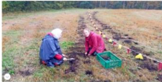
Barth. Rettung für eine vom Aussterben bedrohte Heilpflanze - die

Sie ist seit Jahrhunderten eine der bedeutendsten Heilpflanzen - die Arnika. In Mecklenburg-Vorpommern ist sie jedoch äußerst selten geworden. Zur Bestandsrettung wurde bei Barth eine Pflanzaktion durchgeführt.