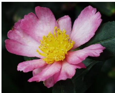
Camellia sasanqua ‚Rubra‘